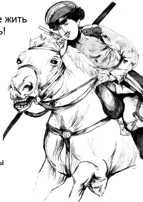
Рисунок Коробейниковой Елизаветы Саратовская обл, р.п. Ровное

Мы волжские казаки, Удалые мы ребята, Век готовы мирно жить, Честью с детства дорожить! Малышей не обижать, Память предков сохранять, Чтить законы казаков Каждый с юности готов! Всех обычаев не счесть. Казаку дороже честь! А без шашки и коня Не прожить нам даже дня. Вот такие мы, ребята, Все-лихие казачки! Мы готовы в дружбе жить И Россией дорожить!